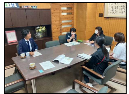
【長瀧代表との話し合い】

新年度がスタートして ふた 二月になろうとしています。大型連休も過ぎ、各学年とも校外学習にも出かけ始めました。5月31日からは1泊2日ではありますが、5年生が林間学校に出かけていきます。(修学旅行は、6/28～30日を予定しています。)クラス替えがあった学年も、学級担任が替わった学級も、緊張感がほぐれ、いわゆる通常の学校生活を迎えています。そんな中、子どもたちの様子を見るために学校内を巡っていると、ここかしこで子どもの成長した姿に出会うことが多く、とても嬉しなります。昨年までは出来なかったことが出来るようになった個の姿、落ち着き、思いやり、優しさが漂うクラスの雰囲気。人の成長は、一朝一夕で確認できるものではありませんが、確実に上に伸びようとする個や集団の芽を、ナスの苗やキュウリの苗を大切に育てるように、学校としても支えていきたいと思えます。一方で、お預かりをしている355名の中には、少なからず令和5年度という新しい波に乗り切れていないお子様もいると思えます。そのような状況があったり或いは見かけたりした場合は、どうぞ学級担任をはじめ教頭など、学校側にお伝えいただきたいと思えます。