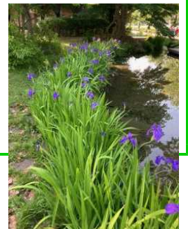
【押杜の杜若(かきつばた)】