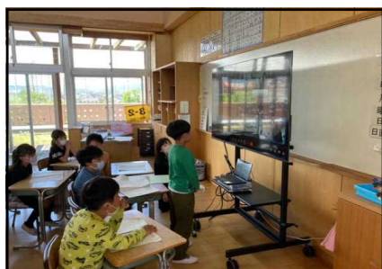
【リモート画面に向かい意見を述べる児童】

教職に身を置いて30余年になりますが、未だに子どもたちから教わることと言いましょか、子どもたちから学ぶことが多々あります。先日も、年度はじめての児童総会が開かれた折、児童会本部や委員会に対してという形ではありましたが、子どもたちから多くの意見・要望が寄せられました。それらを聞く中で私は、今年、校長として「もっともっという学校」を標榜していますが、「もっともっという学校」は、校長の考えるものばかりではなく、「皆からのリクエストの多かった本を、読み聞かせで読んで欲しい」といった、子どもの身近な素朴なものもあるのだと、改めて気付かされました。もっともっという子どもの声に耳を傾け、子どもに学ぶ。この姿勢を、教師で有る限り大切にしていかなければ、「もっともっという学校」には近づけないと、再度、教えてもらいました。